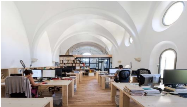
Siège social à Auch (32) – Pierre verte